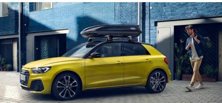
Barras de techo y Portaequipaje