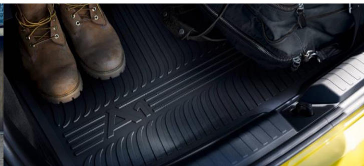
Pisos de goma y protección maletero