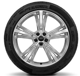
Llanta 21" disponible para versiones 45 TDI Sport y 55 TFSI Sport

Equipamiento de serie: Rueda de repuesto y sensor presión de neumático