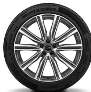
Llanta 21" disponible para versiones 45 TDI y 55 TFSI