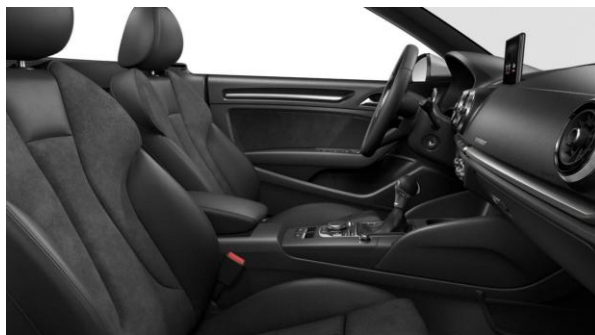
Tapizado de asientos en Cuero Alcántara