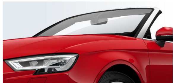
Nuevos diseño faros LED