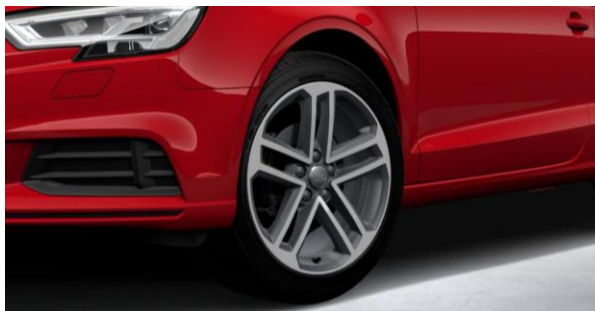
Llantas de aleación ligera 8J x 18. Diseño de 5 radios dobles. Neumáticos 225/40 R 18