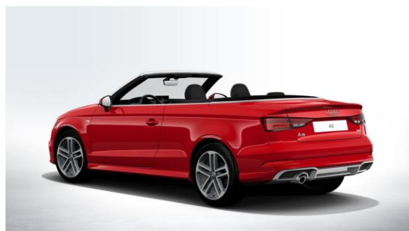
Paquete deportivo Sline Exterior