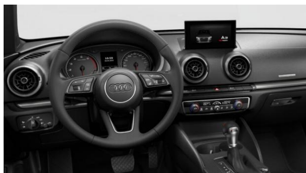
Volante multifuncional deportivo con shift paddles