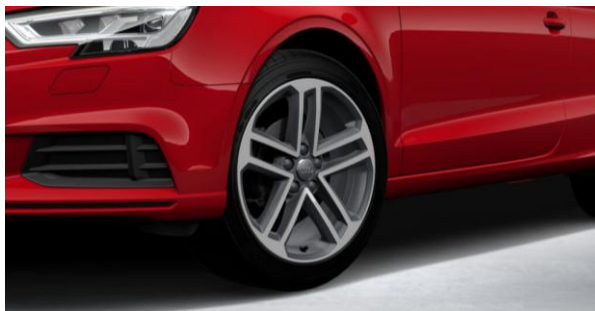
L Llantas de aleación ligera 8J x 18. Diseño de 5 radios dobles. Neumáticos 225/40 R 18