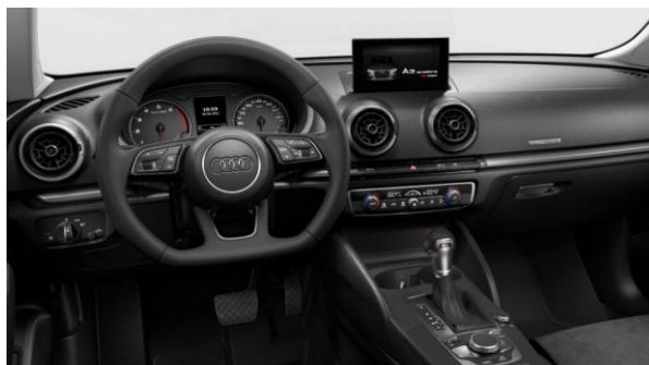
Volante achatado deportivo con shift paddles.