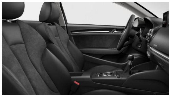
Tapizado de asientos en Cuero Alcántara